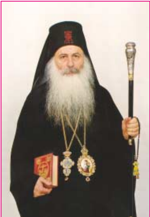
Ο ΠΑΝΑΓΙΟΤΑΤΟΣ ΜΗΤΡΟΠΟΛΙΤΗΣ Γ.Ο.Χ. ΤΗΣ ΓΝΗΣΙΑΣ ΟΡΘΟΔΟΞΟΥ ΕΚΚΛΗΣΙΑΣ † Ο ΘΕΣΣΑΛΟΝΙΚΗΣ κ.κ. ΧΡΥΣΟΣΤΟΜΟΣ