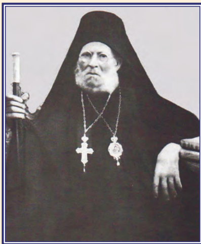
Ὁ Ἀρχιεπίσκοπος τῶν Γ.Ο.Χ. Ἀθηνῶν & πάσης Ἑλλάδος Ματθαῖος Α΄ Καρπαθάκης 1/3/1861-14/05/1950

Αἱ Ἀποστολικοῦ κύρους Χειροτονίαι αὐταὶ τοῦ Βρεσθένης Ματ-